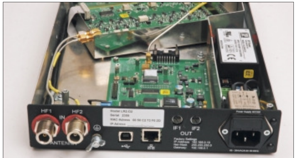
Neben den zwei Antennenbuchsen in N-Norm zeigt die Rückseite auch weitere Anschlüsse – wie für LAN und USB.